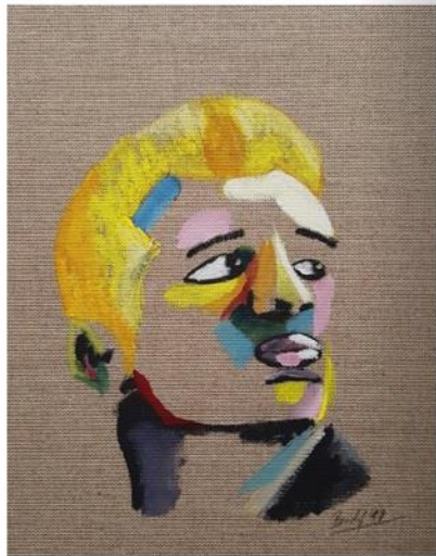
Denis (18x24x0,3cm) Gouache auf Leinen ----- Denis (18x24x0,3cm) Gouache on Linen