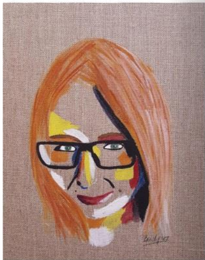
Laura (18x24x0,3cm) Gouache auf Leinen ----- Laura (18x24x0,3cm) Gouache on Linen